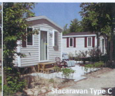
Stacaravan Type C