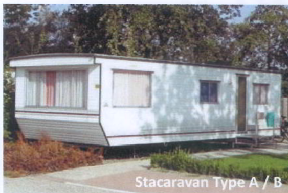
Stacaravan Type A / B

Kleine stacaravan van het merk IRM met een afmeting van 4 bij 4 meter. In deze compact-caravan is een badkamer met toilet en douche, slaapkamer, ingerichte keuken en televisie. In deze caravan kunnen maximaal 2 personen verblijven.